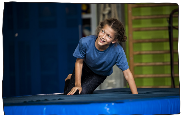
Matten sind esenziell beim Üben krasser Stunts

Klappe und Action! Geschickte und waghalsig wirkende Kunststücke werden in eine Geschichte verpackt. Die gewagten Kunststücke und Tricks werden durch Spezialeffects, schauspielerisches Geschick und passender Musik verstärkt. Klar ist: Die Zuschauer*innen werden in sinnlicher Wahrnehmung an den dramatischen Ereignissen der Geschichte teilhaben!