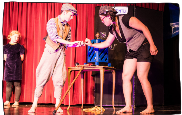
Hokus Pokus Fidibus!