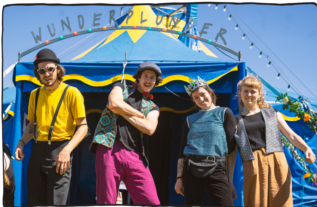
Willkommen in der Welt des Theaterzirkus Wunderplunders.

Nach dem Schnuppern kann man sich beim Theaterzirkus bewerben. Dafür benötigt das Team einerseits ein Motivationsschreiben, -video oder eine andere Kreativform plus die üblichen Bewerbungsunterlagen wie Lebenslauf und Referenzen.