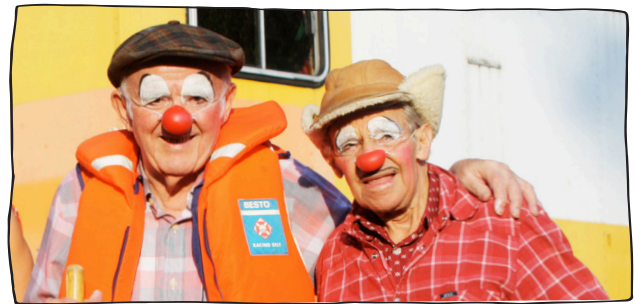
Rote Nasen ahoi!

Grosse Schuhe, schräge Kleider, ulkige Requisiten, knallrote Nasen! Ob lustig, traurig, komisch, tragisch, bunt oder schwarz-weiss... Figuren und Geschichten werden selber ausgeüftelt. Alles kann in einer Woche entstehen. Die Belohnung ist das Lachen des Publikums – was gibt's Schöneres?