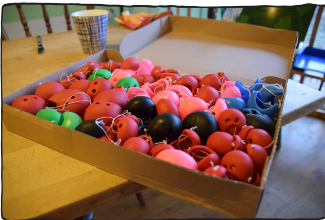
Vorbereiten auf die Tournee, dann wollen diese Nasen nämlich getragen werden.

Der Wunderplunder erledigt administrative und organisatorische Arbeiten zu fast 100% selbst. Dabei kümmert sich jemand um die Finanzen und jemand um das Fundraising . Die Tourneeplanung hat Kontakt mit allen aktuellen und zukünftigen Veranstaltenden. Dieses Dokument, welches du gerade liest, wird gestaltet und geschrieben von den Verantwortlichen für Öffentlichkeitsarbeit und Grafik . Zusammengefasst unter Administration ist die Verantwortung für das gesamte Büromaterial und sämtliche Postversände.