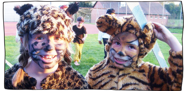
Aufgepasst, die Raubkatzen sind frei!