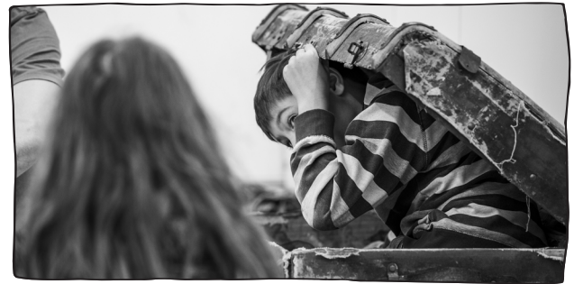
Wer hat sich denn da im Gepäck versteckt?