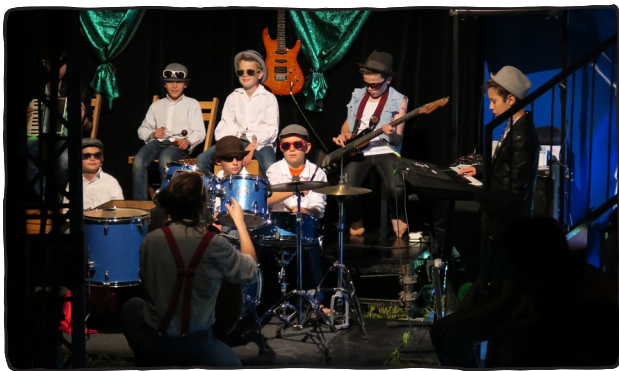
Licht aus, Musik an.