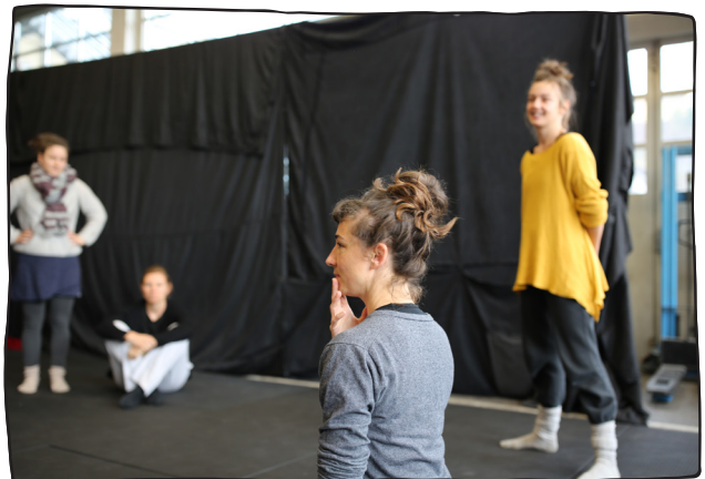
...gehört aber auch in die Theaterprobezeit.

Das jährlich wechselnde Theaterstück wird von allen Teammitgliedern gemeinsam mit einer professionellen Regie entwickelt und während der Tournee jede Woche aufgeführt. Die Musik zum Stück spielt das Team selbst. Das Bühnenbild wird von mehreren Teammitgliedern geplant und realisiert. Hier sind Fantasie und Kreativität gefragt.