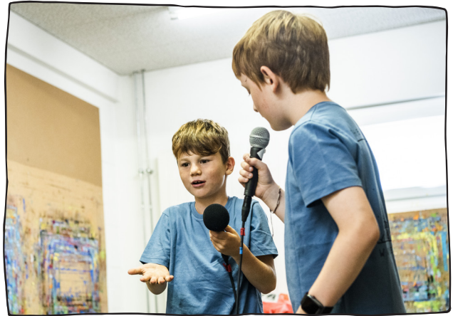
Ausprobieren ist ein wichtiger Bestandteil einer Animationswoche...

Als Zirkusanimat*innen erarbeiten die Teammitglieder jede Woche eine einzigartige Zirkusnummer. Der Fokus liegt dabei auf einem für alle Teilnehmenden befriedigenden Auftritt. Neben der Übungszeit mit den Kindern überlegen sich die Animationspersonen welche Kostüme zu ihrer Gruppe passen, welche Lichteinstellung und welche Musik ihre Nummer bereichern könnte. Bestehendes Wissen in der einen oder anderen Zirkusdisziplin kann in diese Arbeit eingebaut werden, ist jedoch nicht nötig. Viel wichtiger ist ein Interesse an der Arbeit mit Menschen von gross bis klein, mit und ohne Beeinträchtigung, aus den verschiedensten Lebenssituationen.