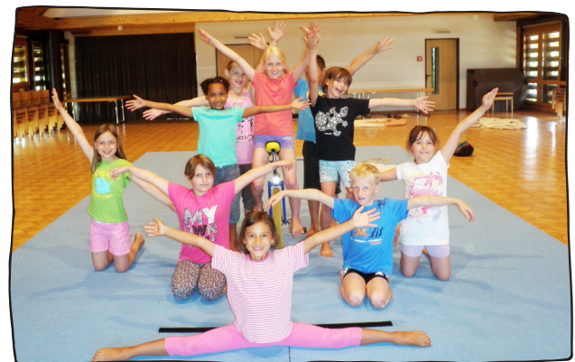
Lächeln und präsentieren!

In schönen Kostümen werden Bilder auf die Bühne gezaubert. Purzelbäume sorgen für Tempo. Beim Bauen von Menschenpyramiden braucht es Konzentration und das gegenseitige Vertrauen aller Beteiligten. Wie kann man einander Hilfe leisten, wer macht welche Kunststücke und wie heilt man Muskelkater? Der Anfang ist nicht immer einfach, das Erlebnis jedoch unvergesslich.