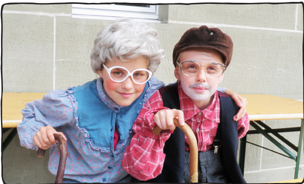
Wenn die Jungen mal Alt sein können.

Der Theaterzirkus Wunderplunder bietet ein breites Programm an Zirkusdisziplinen an. Je nach Woche variiert das Angebot. Immer am Montag können die Teilnehmenden auswählen, welche Disziplin sie gerne am Freitag auf der Bühne präsentieren wollen. Jedes Teammitglied bietet von Woche zu Woche eine andere Disziplin an. Die verschiedenen Angebote des Theaterzirkus Wunderplunders werden im Folgenden kurz beschrieben.