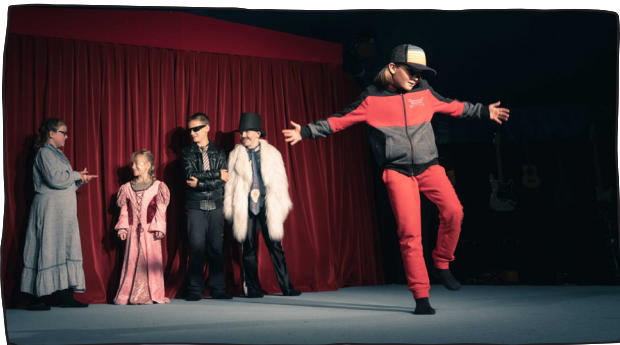
Die Ausstrahlung ist die halbe Miete...

Theater spielen geht auch ohne Worte. Die Gruppe stellt sich der Herausforderung eine Geschichte ohne Worte sondern mit Gesten, Gesichtsausdrücke, Requisiten und Kostümen zu erzählen. Der Fantasie sind keine Grenzen gesetzt – Ein Raub in einer Bäckerei, seekranke Menschen auf einem Kreuzfahrtschiff oder ein Ausbruch aus dem Altersheim.