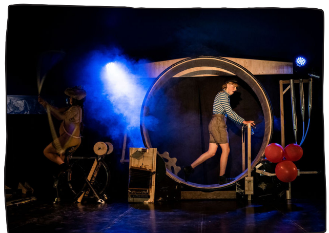
Auch das Bühnenbild bauen wir selbst...

Dies sind Erfahrungswerte und können von Jahr zu Jahr abweichen.