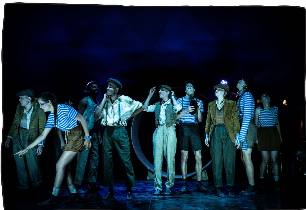
Die Bühnenzeit aller elf Kollektiv-Mitglieder sollte ausgeglichen sein.

Viel Freiraum um zu improvisieren, auszuprobieren, zu spielen, ungeahnte Talente und versteckte Seiten zu entdecken und Zeit für körperliches Training sind uns wichtig. Gerne lernen wir verschiedene Theaterstile und –übungen und Trainingsmethoden kennen. Die Theaterprobezeit ist für uns auch eine Vorbereitung für die eigene Regiearbeit mit den Animationsgruppen auf Tournee. Auch legen wir grossen Wert auf persönliche Figurenarbeit und Rollenentwicklung. Einen Überblick über die Gesamtprobezeit und Stückentwicklung sind erwünscht.