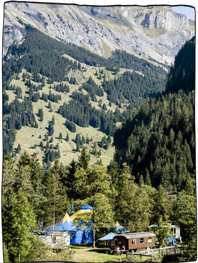
Auch exotische Orte gehören zur Wunderplunder Tournee – hier in Kandersteg.

Im März beginnt die Probezeit für das Theaterstück, welches auf Tournee vom Team einmal wöchentlich aufgeführt wird. Der Verein Theaterzirkus Wunderplunder wird von 11 Teammitgliedern als Kollektivbetrieb geführt. Wichtige Entscheidungen werden im Team gefällt. Die Aufgaben und Kompetenzen der verschiedenen Arbeitsbereiche sind aufgeteilt in etwa 30 Ressorts und werden von den Verantwortlichen wahrgenommen.