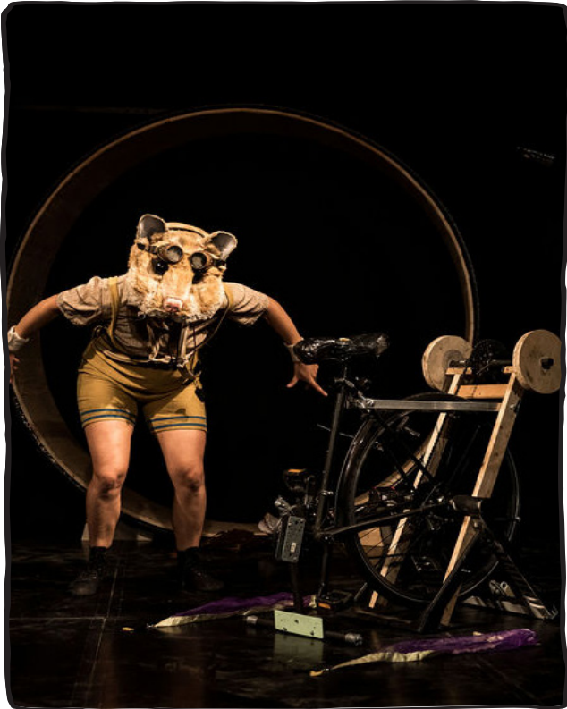
Der Hamster Herkules entdeckt die von Serafin gebaute „Chipslimaschine“

Ob Epos, Legende oder eine klassische Komödie. Der Wunderplunder verwandelt mit jeder Produktion sein Zelt in eine Wunderwelt, in welcher das Publikum für etwas mehr als eine Stunde den Alltag vergessen kann und eintaucht, in eine Geschichte voller Farben, Akrobatik und Abenteuer.