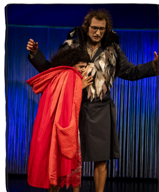
Entstehende Freundschaft zwischen Rotkäppli und „bösen“ Wolf